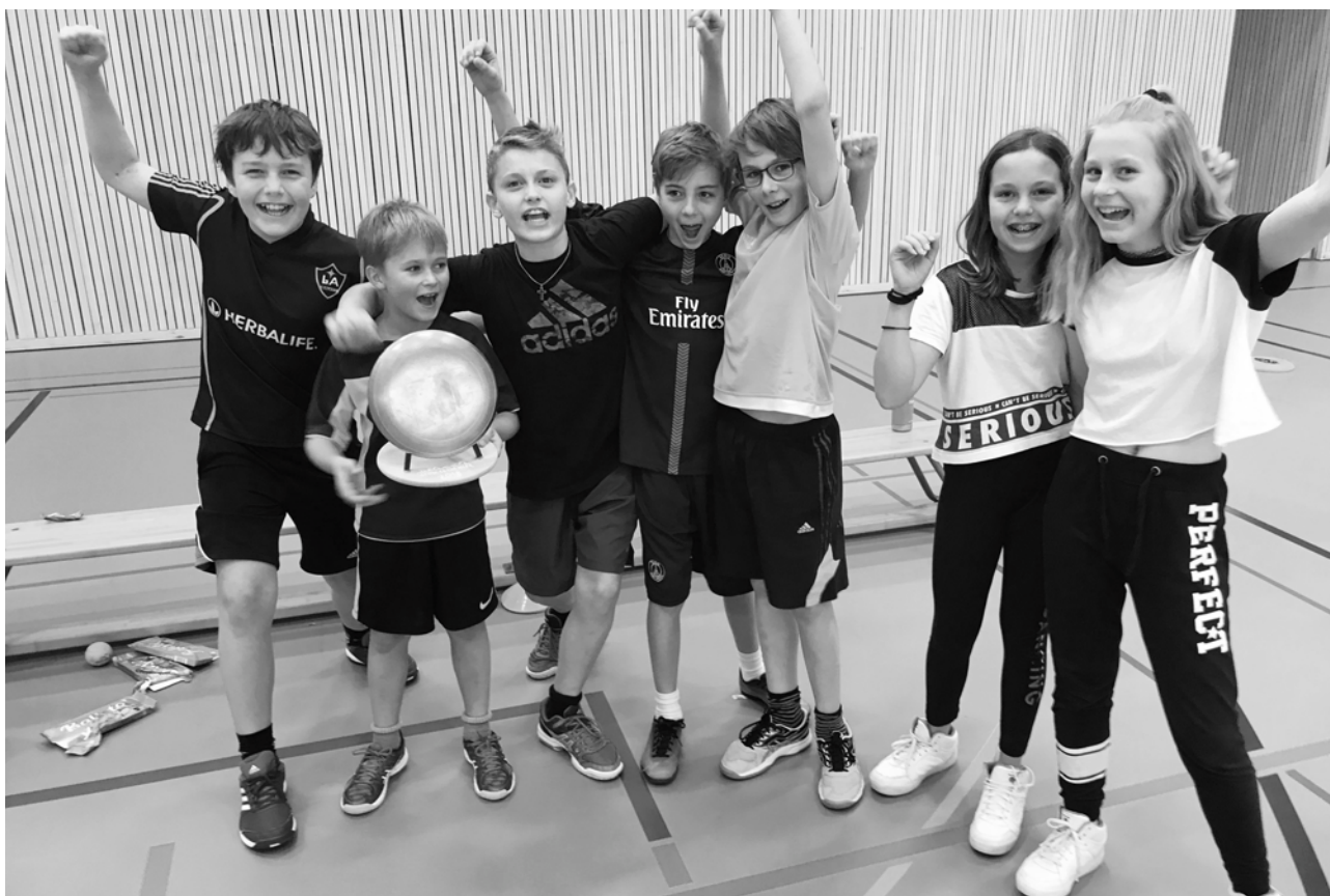
Die Gewinner des goldenen Frisbees 2018 kamen von der Klasse 6d, St. Martin, Sursee