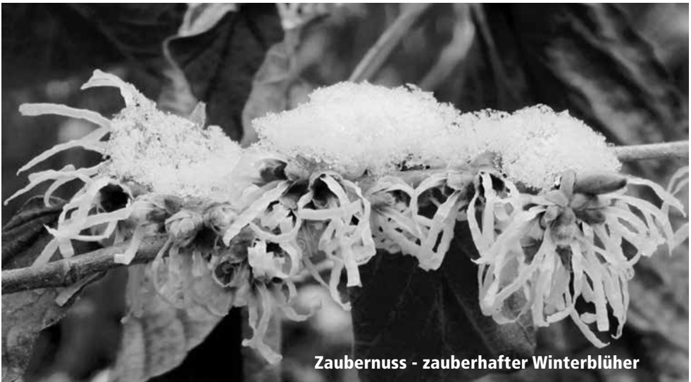
Zaubernuss - zauberhafter Winterblüher

* in der Regel Wortgottesdienst mit Kommunionfeier