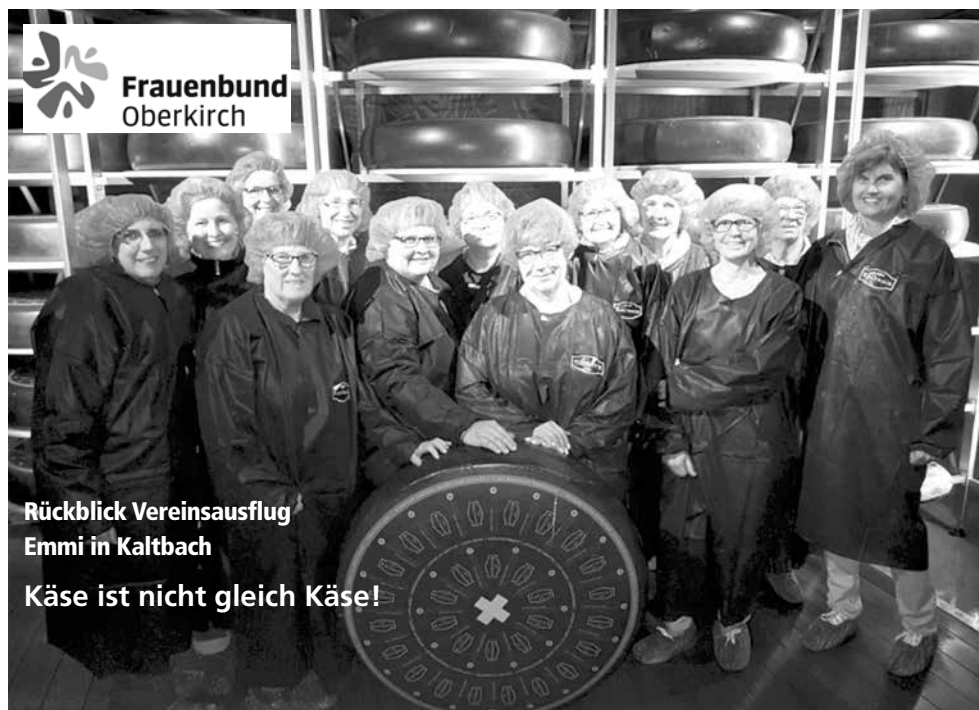
Rückblick Vereinsausflug Emmi in Kaltbach