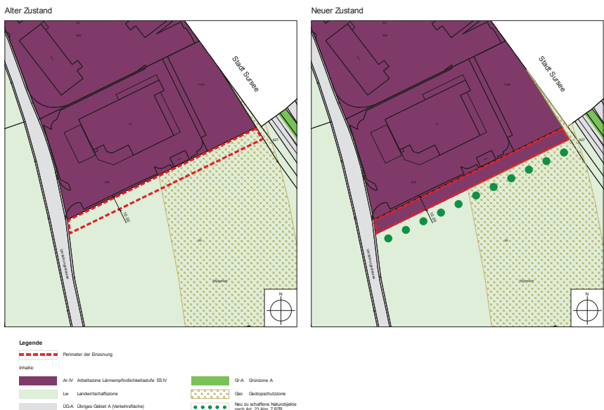
Abbildung 3: Gegenüberstellung des alten resp. neuen Teilzonenplans Landi

Die Einzonung tangiert einen Moränenwall, ein Geo-Objekt von regionaler Bedeutung. Die Geotopschutzzone wird reduziert, da sie andernfalls die Arbeitszone überlagert. Dies ist weder zweckmässig noch in der Zonenbestimmung der Geotopschutzzone vorgesehen. In der Gemeinde Oberkirch ist es nicht üblich, den Geotopschutz innerhalb der Bauzonen aufrecht zu erhalten.