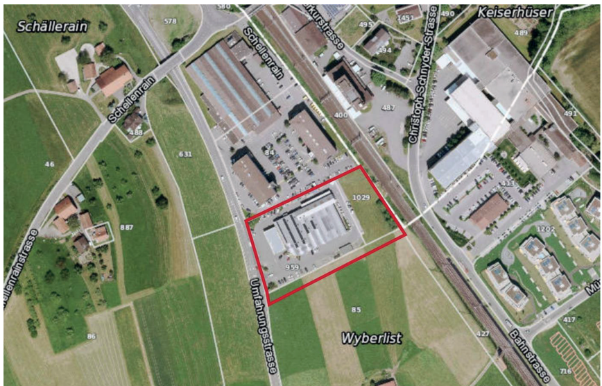
Abbildung 1: Lage des Landi Markts in Oberkirch (Geoportal Kanton Luzern, 2019)

Mit den Erweiterungen muss auch die Anlieferung neu organisiert werden. Die Warenlogistik soll im Einbahnverkehr um die Gebäude geführt werden. Um weiterhin einen kundenfreundlichen Verkehrsfluss und ausreichende Parkierungsflächen zu ermöglichen, soll die bestehende Arbeitszone um einen 10 m breiten Streifen (ca. 1'470 m 2 ) auf der südlich angrenzenden Parzelle Nr. 85 eingezont werden.