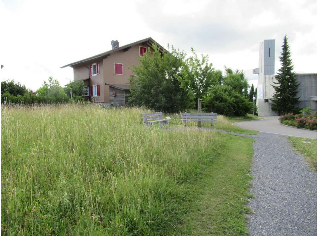
Wegnahe Bereiche können häufiger gemäht werden.