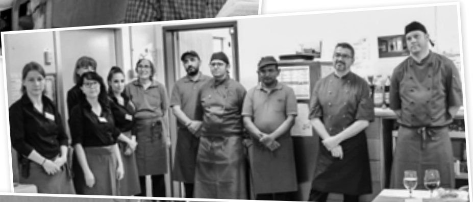
Das Service- und Küchenteam